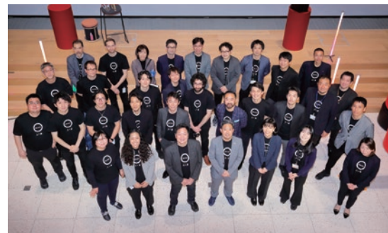
資本業務提携先のアセントロボティクス株式会社とソフトロボティクス ベンチャーズの創業メンバー

に優れたデザインを選出しており、2023年は世界56の国と地域から約11,000件の応募の中から、わずか75件が最高賞である「iFゴールドアワード」に選出されました。